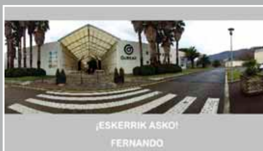
Bideoaren irudi bat.